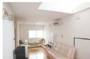
●ウェイトニングルーム