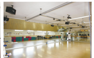
●エクササイズルーム