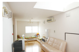
●ウェイトニングルーム